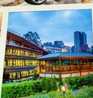
ห้องสมุดเป่ย์โถว