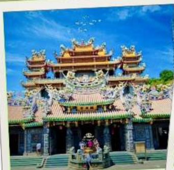
วัดกวนตู่