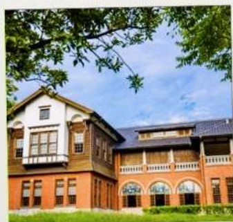
พิพิธภัณฑ์น้ำพุร้อนเป่ย์โถว