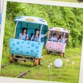
Shen'ao Rail Bike