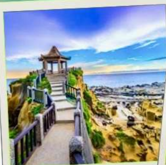
อุทยานเกาะเหอผิง