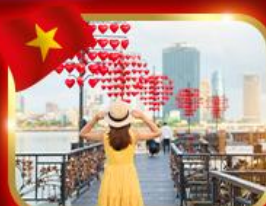
เช็กอินสะพานแห่งความรัก