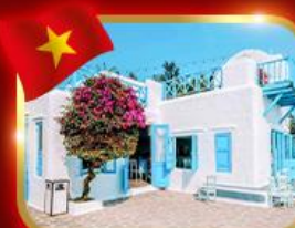
คาเฟ่สุดชิค ซานทรา มาริน่า