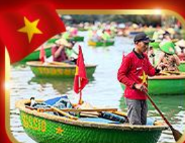
เรือกระด้ง หมู่บ้านกัมทาน