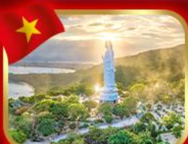
ขอพรกวณอิม วัดหลินอึ้ง