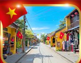
เมืองมรดกโลก ฮอยอัน