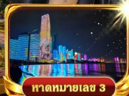
หาดหมายเลข 3