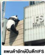
แพนด้ายักษ์ปีนตึกIFS