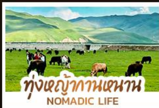
ทุ่งหญ้ากานหนาน NOMADIC LIFE