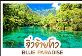
จิวจ้ายโกว BLUE PARADISE