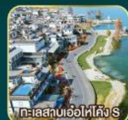
ทะเลสาบเอ๋อไห่คัง S