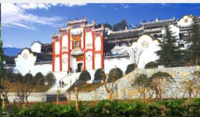
บ้านเกิดชวีหยวน