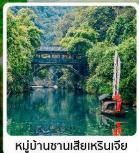
หมู่บ้านซานเสี่ยเหรินเจีย