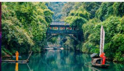
หมู่บ้านซานเสีเหรินเจีย