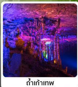
ดำเก้าทพ