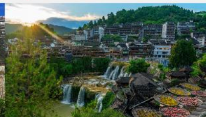
หมู่บ้านโบราณฝูหรงเจิ้น

*ทางบริษัทฯ ขอสงวนสิทธิ์ในการสลับโปรแกรมทัวร์ตามความเหมาะสมขึ้นอยู่กับสถานการณ์หน้างาน โดยคำนึงถึงผลประโยชน์ของลูกค้าเป็นสำคัญ