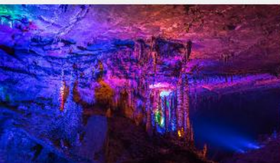
ต้าเก้าเทพ