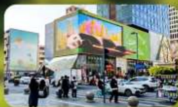
ไท่กุ่หลี่