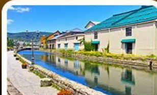
คลองโอตารุ