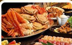
บุฟเฟ่ต์ซาบุมุ+ซาปู 3 ชนิด