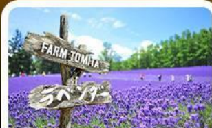
โทมิตะฟาร์ม