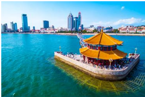
สะพานจ้านเจียว

รับประทานอาหารเช้า ณ ห้องอาหารของโรงแรม (10)