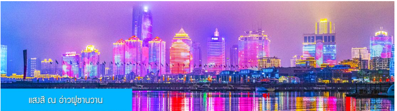
แสงสี ณ อ่าวฟูซานวาน