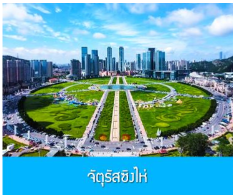
จัตุรัสชิงไห่

หลังอาหารนำท่านสู่ สวนเชอร์รี่ 樱桃园现摘樱桃 ให้ท่านสัมผัสประสบการณ์สุดชิล ด้วยการเด็ดเชอร์รี่สดจากต้นภายในสวนเชอร์รี่ (เชอร์รี่จะของเมืองนี้จะเริ่มสุกและเก็บได้ในช่วงปลายเดือนพฤษภาคม - มิถุนายนของทุกปี ในกรณีที่ผลเชอร์รี่น้อยหรือหมดเร็วกว่าปกติ ทางทัวร์ขอสงวนสิทธิ์ในการจัดโปรแกรมอื่นแทนการเด็ดเชอร์รี่)