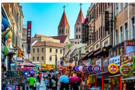
ถนนวาชาน