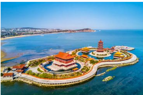
อุทยานท่องเที่ยวแปดเซียนข้ามทะเล

เที่ยง รับประทานอาหารกลางวัน ณ ภัตตาคาร (5)