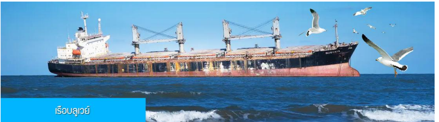
เรือบลูเวย์

เช้า รับประทานอาหารเช้า ณ ห้องอาหารของโรงแรม (7)