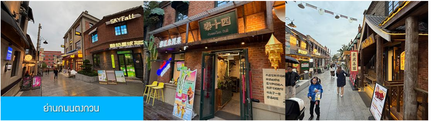
ย่านถนนตวงวน