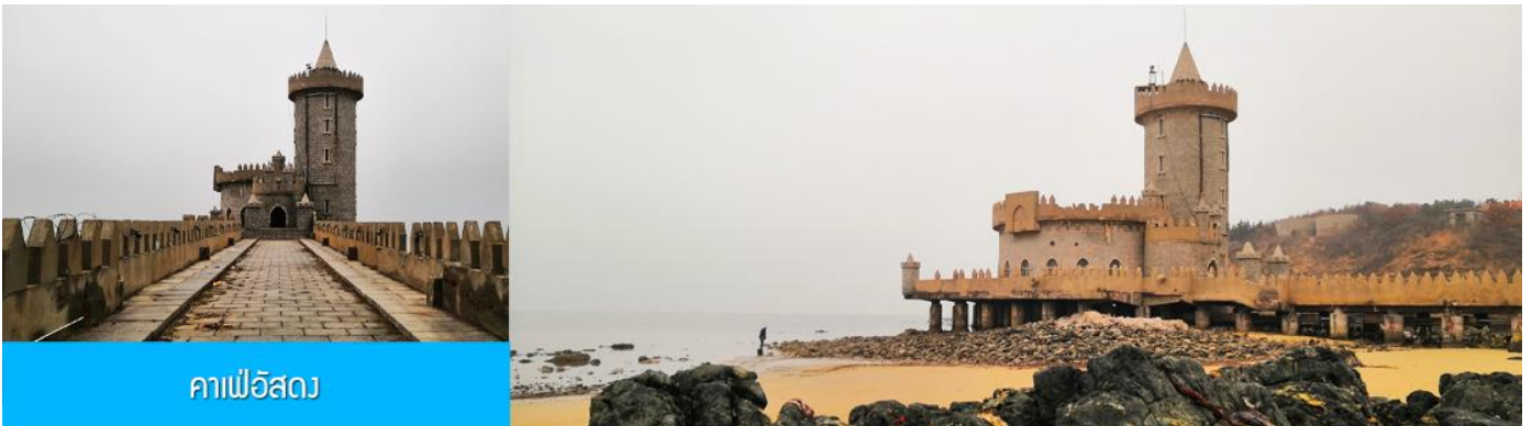
คาเฟ่อีสดง

จากนั้นนำท่าน เดินทางสู่ คาเฟ่อีสดง 落日古堡 นำท่านชมปราสาทในเทพนิยาย ที่ตั้งตระหง่านอยู่ริมชายหาดนานาชาติเวย์ไห่ คาเฟ่ที่ออกแบบด้วยสถาปัตยกรรมสไตล์ยุโรป ตกกับวิวทะเลสีคราม และที่นี่คือแม่เหล็กดึงดูดนักท่องเที่ยวมาเก็บบรรยากาศความสวยงามความโรแมนติก (ตัวปราสาทเป็นร้านคาเฟ่ หากท่านต้องการเข้าไปด้านใน ต้องจ่ายค่าเครื่องดื่ม ตามเมนูของทางร้าน ซึ่งไม่รวมในอัตราค่าทัวร์)