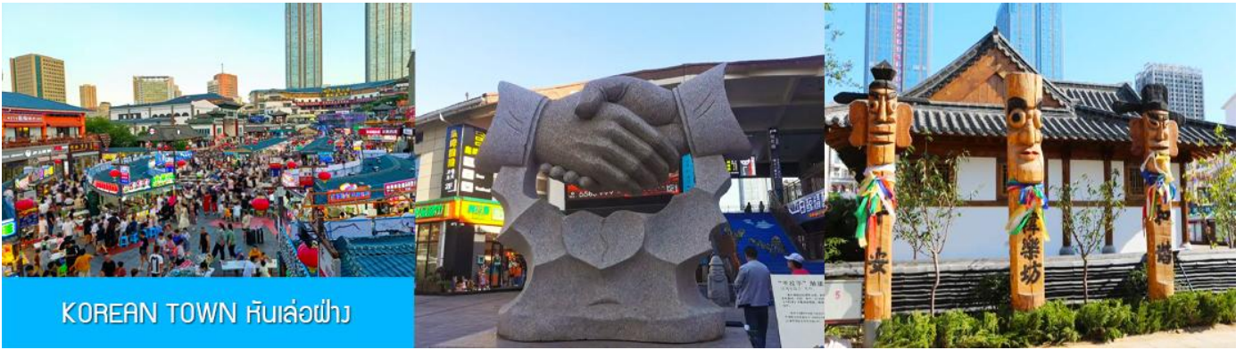
KOREAN TOWN หันเล่อฝาง