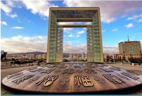
ประตูแห่งโชคกลาง