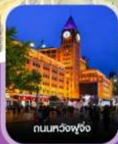
ถนนหลวงฟู้จิ่ง