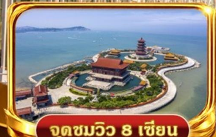
จุดชมวิว 8 เซียน