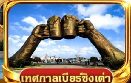
เทศกาลเบียร์ชิงเต่า