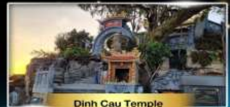
Dinh Cau Temple