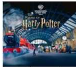
แฮร์รี่ พอตเตอร์ สตูดิโอโตเกียว