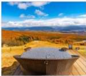
ดิโยซาโตะเทอเรส