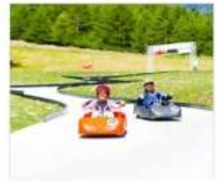
กิจกรรมขับโกคาร์ท