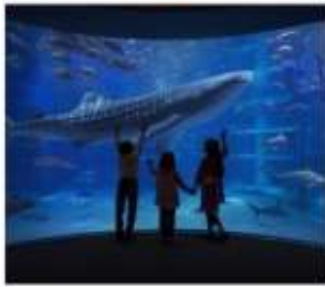
พิพิธภัณฑ์สัตว์น้ำโดยดั่ง