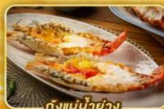
กุงเม่น้ำย่าง