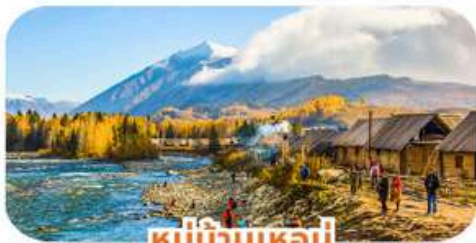
หมู่บ้านเหม่จู