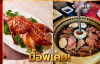
เปิดอย่างฮ่องกง บุฟเฟ่ต์ปิ้งย่างเกาหลี