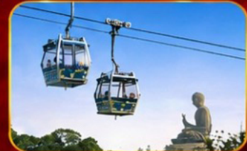
กระเชานองปิง