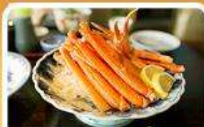
พิเศษ! ชาบู