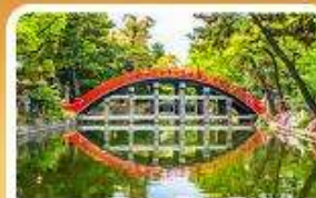
ศาลเจ้าสุมิโยชิ โทคะ