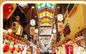
ตลาดปลาชิชิ