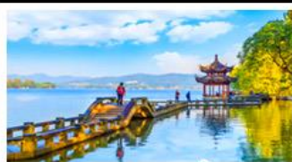
ทะเลสาบซึกุ