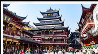
ตลาดร้อยปีเฉิงหวังเมียว