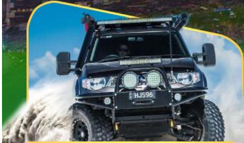
คันรถ 4WD สู่ใจกลางเทือกเขาคอเคซัส