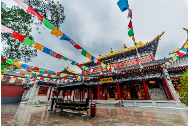
พาท่านชม วัดลามะกว้างเหริน (Guangren Temple) (ระยะทางประมาณ 5 กิโลเมตร ใช้เวลาเดินทางประมาณ 10-15 นาที)

วัดพุทธทิเบตที่เก่าแก่ในเมืองซีอานและเป็นวัดลามะเพียงแห่งเดียวของมณฑลส่านซี วัดกว้างเหรินเปรียบเสมือนสัญลักษณ์ของความสัมพันธ์ทางวัฒนธรรมระหว่าง 'ฮั่น' และ 'ทิเบต' เคยผ่านการบูรณะมาแล้วหลายต่อหลายครั้ง วัดลามะแห่งเดียวในนครซีอานนี้สร้างขึ้นเมื่อ ค.ศ. 170 เป็นสถานที่ที่ผสมผสานวัฒนธรรมจีนและทิเบตอย่างลงตัว