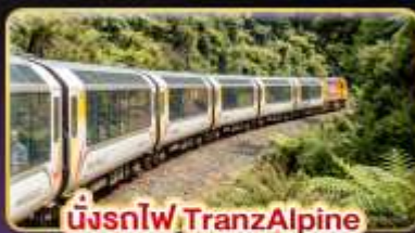
นั่งรถไฟ TranzAlpine