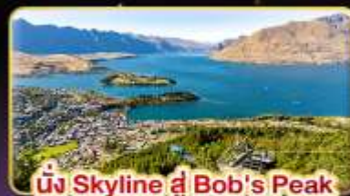
นั่ง Skyline ที่ Bob's Peak