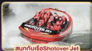
สนุกกับเรือ Shotover Jet