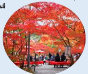
ที่ให้ภาพบรรยากาศท้องถื่นของลานหนึ่งสีแดง ที่ปกคลุมไปด้วยใบไม้เปลี่ยนสี