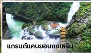
แกรนด์แคนยอนกงเหริน