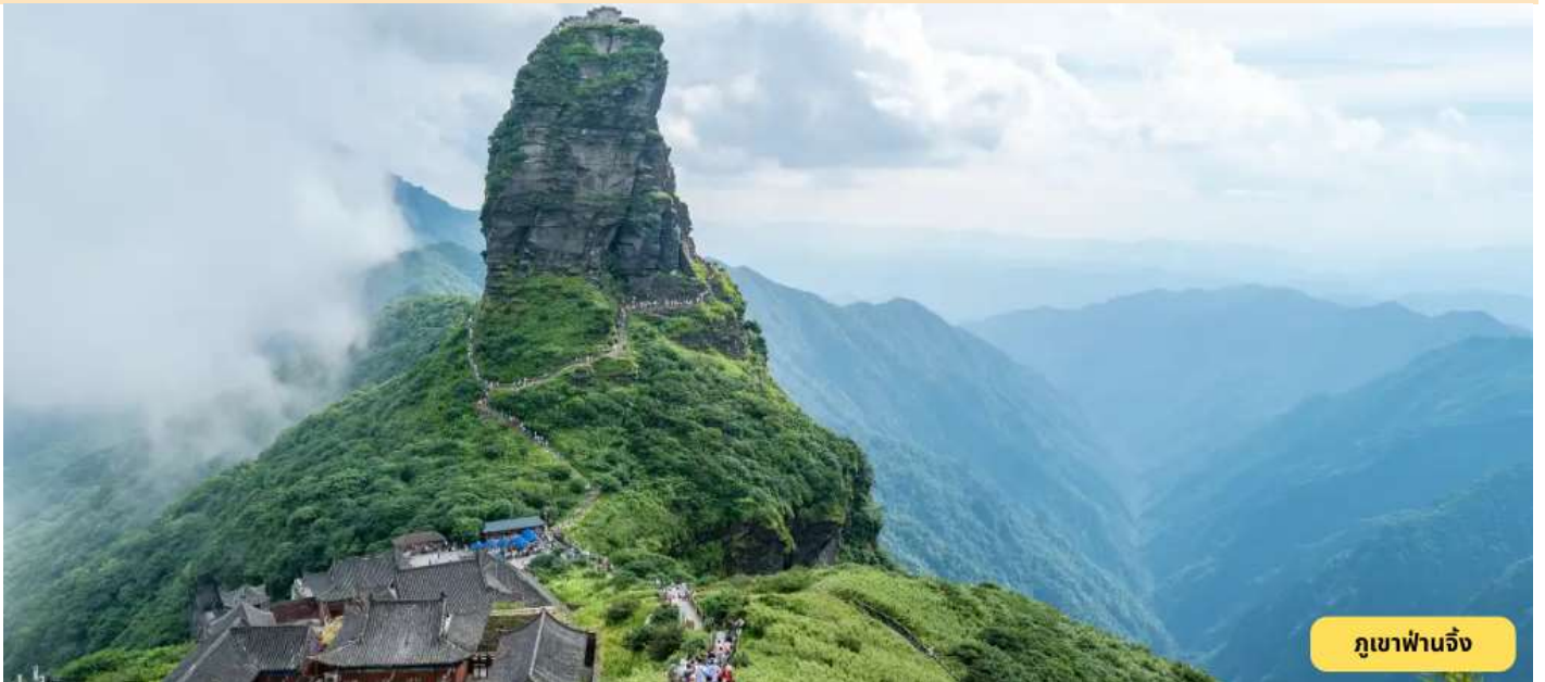
ภูเขาฟานจิ้ง

เดินทางสู่อำเภอเจียงโข่ว - หมู่บ้านม้งหยุนซื่อ - ภูเขาฟานจิ้ง (กระเช้าขึ้นลง+รถอุทยาน) - ยอดหมอกแดงทอง - เสาคินเห็ด - เดินทางสู่ถองเหริน