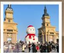
ตึกตาคีเย-ยักซ์