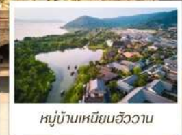
หมู่บ้านเหนียนฮิววาน

🗳️ โหลด 23 KG. x1 ทั้งไป - กลับ ✓ พรีเมียมทัวร์ ✓ ไม่เข้าร้านรัฐบาล ✓ ทัวร์กรุ๊ปเล็ก ✓ รวมค่าเข้าชมที่ตามโปรแกรม