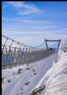
ยอดเขาทิสลิส