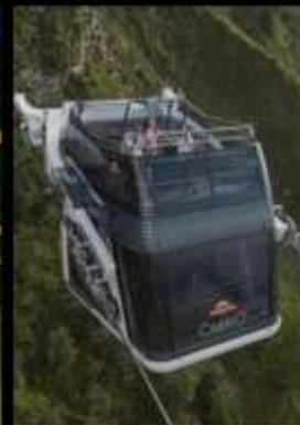
ยอดเขาสแตนเซอร์ฮอร์น