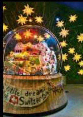
ยอดเขายองเฟรา