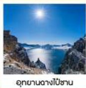
อุทยานดางไป่ซาน