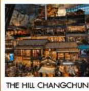
THE HILL CHANGCHUN