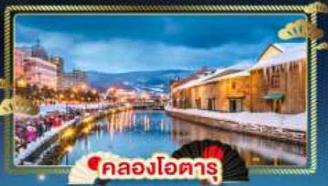
🏠 คลองโอตารุ