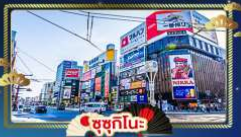
🏙️ ซุกุชิโนะ