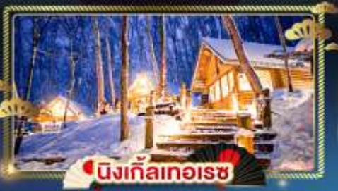
♨️ นิงเกิ้ลทอเรีย