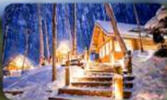
นิงเกิ้ลเทอเรส

Sapporo Tokyu REI หรือเทียบเท่ามาตรฐานญี่ปุ่น