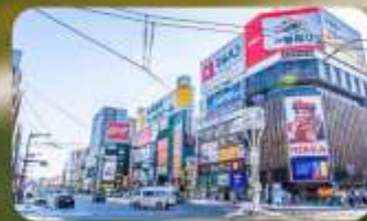
ซูซูกิโนะ