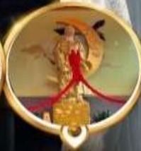
วัดหวังต้าเซียน ทงพรความรัก