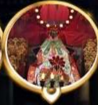
วัดเจ้าแม่กวนอิมซ่งฮ่า ทงพรสูงทาก