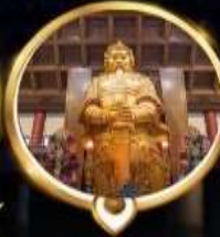
วัดเขangk ทงซอคลาก