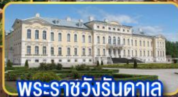
พระราชวังรินดาลา