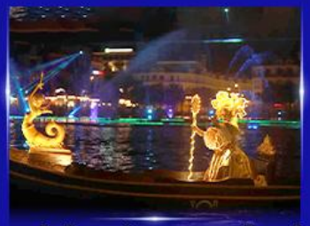
ชมโชว์เวนิสจำลอง แกรนด์วิลด์