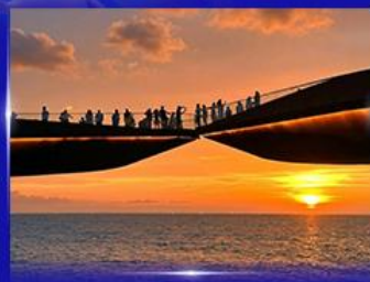
สะพานจูบ Sunset Town