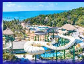
สวนสนุก Sun world Hon thom