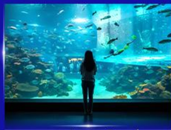
อควาเรียมยักษ์รูมเต่า