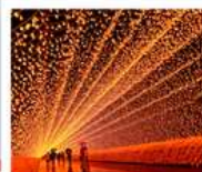
นานานะ โนะ ซาโตะ