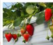
สวนสตรอว์เบอร์รี่