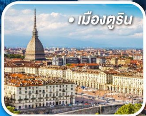
• เมืองตูริน