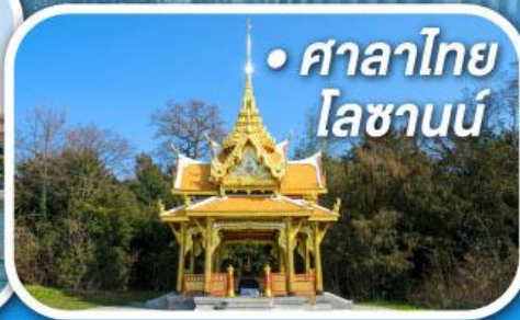
• ศาลาไทย ไอชานน์

• สุดอากาศดีที่เซอร์แมท • ขึ้นกระเช้าสู่อยอดจากลาเซียร์ 3000 • ชมเมืองคลาสสิกเบิร์น ลูเซิร์น ซูริก