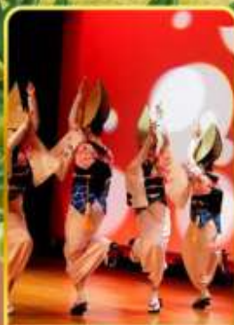
อะวะ โอะโตะริ โคคัง