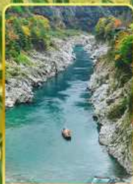
ส่องเรือช่องเขาโอบิเคะ