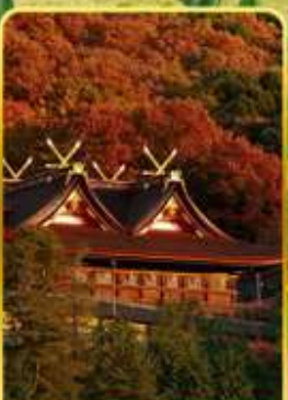
ศาลเจ้าคิมิฮิโกะ

ออนเซ็น 4 คั้น นน.กระเป๋า 23 กก.X2 8Days 5Night