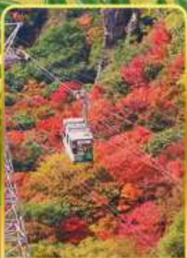
กระเช้าหุบเขาคังคาเคอิ