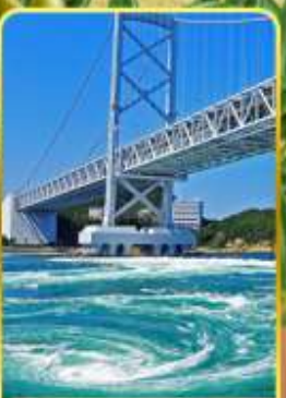
ช่องแคบนารุโตะ