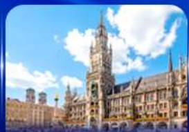
จัตุรัสมาเรียนพลักซ์ มิวนิก