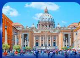
นครรัฐวาติกัน โรม