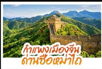
กำแพงเมืองจีน ด่านซือหม่าโต