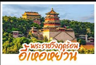
พระราชวังฤดูร้อน อี้เซว่เซว่น