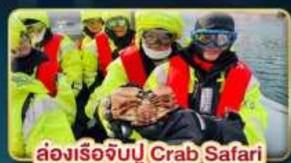
ล่องเรือจับปู Crab Safari

เดินทาง: 08-16 ต.ค. | 07-15 พ.ย. 30 พ.ย. - 08 ธ.ค. 69