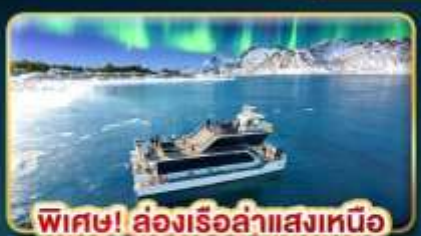
พิเศษ! ล่องเรือล่าแสงเหนือ