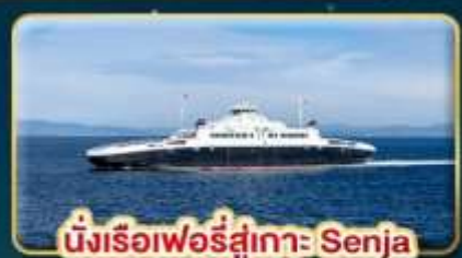
นั่งเรือเฟอร์รี่สู่เกาะ Senja