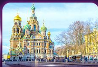
โบสถ์แห่งหยดเลือด