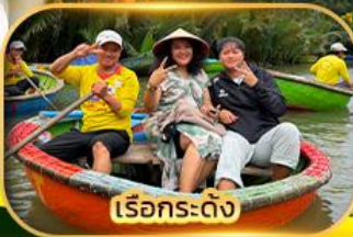
เรือกระดิ่ง