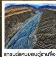
แกรนด์แคนยอนตู้ซานจื่อ