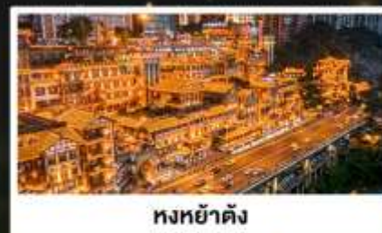
หงหย่าต้ง