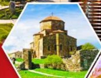
วิหารกอรี