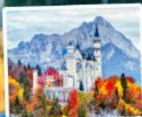
ปราสาทน้อยชวานส์ไตน์