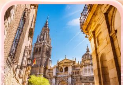
มหาวิหารแห่งโทเลโด